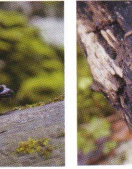
V Javorníkovej doline môžete vidieť napríklad vzácne moky či modro zafarbené šlianičky karpatské.